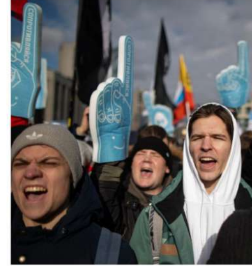
"Throttling" tekniği, Rusya'da yaygın olarak kullanılıyor. Haziran ayında Rus vatandaşları, Twitter'ın kısıtlanmasını yargıya taşıdı.

Ekimde Singapur Parlamentosu, "Yabancı Müdahalelere Karşı Tedbirler Yasasını" kabul etti. Yasa, yetkililere, yabancı kişi ve kuruluşların arkasında olduğundan şüphelendiği, zararlı içerik paylaşımında bulunan kişilerin bilgilerini paylaşmaları konusunda, sosyal medya platformlarına ve internet servis sağlayıcılarına talimat verme yetkisi verdi. Bu örnek, Türkiye hükümetinin istediği zaman sosyal medya şirketlerinden kullanıcı bilgilerini talep etme hakkına benzemektedir.